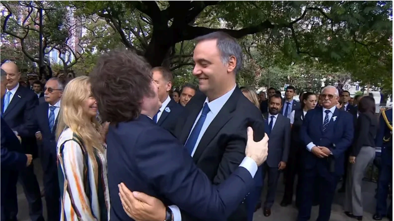
Una encuesta ubica al gobierno de Javier Milei como el segundo más corrupto desde 1983

El gobierno de Javier Milei se ubica como el segundo más corrupto desde el regreso de la democracia, solo por detrás de Cristina Fernández de Kirchner . El dato surge de la última encuesta de la consultora Giacobbe & Asociados , en medio del escándalo que protagoniza el jefe de Gabinete, Manuel Adorni , investigado por presunto enriquecimiento ilícito .