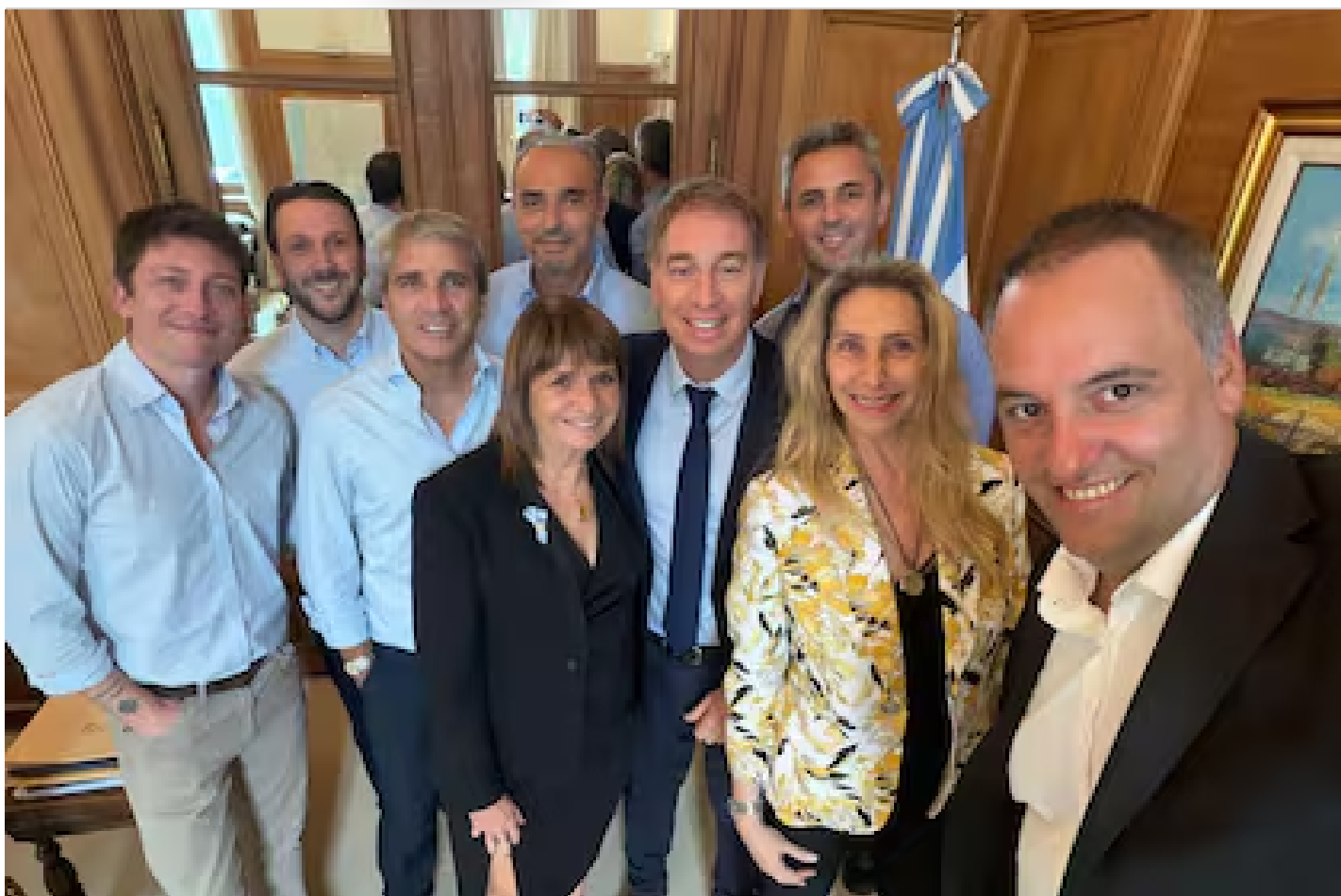
La mesa política del Gobierno Presidencia