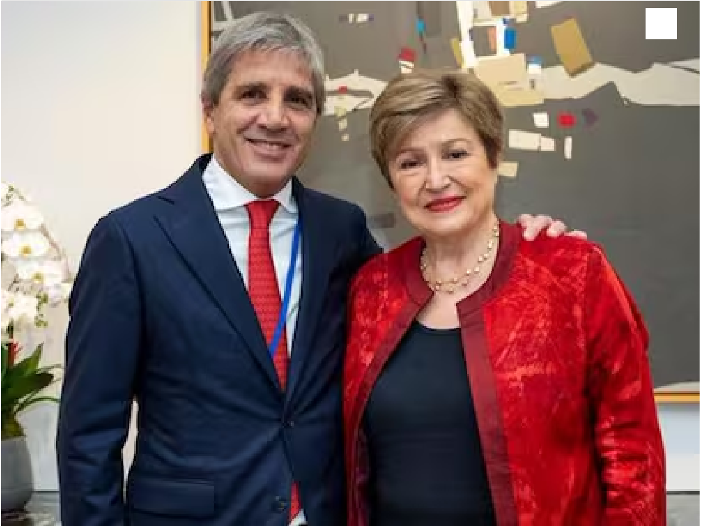
Luis Toto Caputo y Kristalina Georgieva, esta semana en Nueva York

los fundamentals del programa. En concreto, reclamó un acuerdo de gobernabilidad con al menos una decena de gobernadores . Su propuesta fue canjear un apoyo estructural en el Congreso para este año y el próximo, a cambio de un pacto político para no competirles en sus territorios en las elecciones provinciales. Una reedición del debate del año pasado. Es decir, condicionó la suerte del plan económico a una estrategia política .