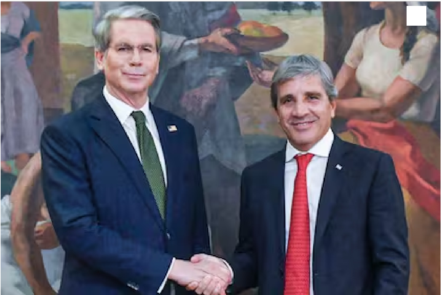
Luis Caputo recibió a Scott Bessent

Pero después vino el tuit de Scott Bessent y la recuperación de la elección de octubre. Otra vez para arriba . Tras el triunfo, recambio de gabinete, internas, y nuevamente dificultades . En diciembre se produjo la renovación del Congreso y las sesiones extraordinarias fueron verdaderamente extraordinarias . Se aprobaron todas las leyes y Milei fue a la Asamblea cargado de gloria. Eso ocurrió el 1 de marzo. Tres días después se realizó el recambio en Justicia, y otra vez el vía crucis .