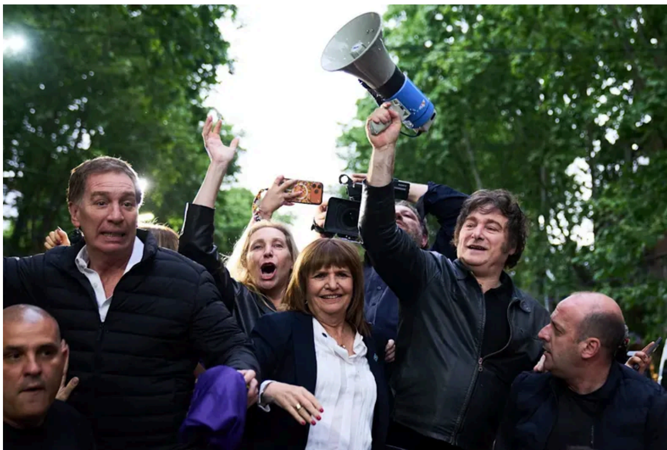
Karina Milei, Javier Milei y Diego Santilli.

Karina Milei busca plantar una bandera política en Suipacha con la realización de un acto de La Libertad Avanza , en el marco de su estrategia para disputar la provincia de Buenos Aires al peronismo, actualmente gobernada por Axel Kicillof . Con ese objetivo, decidió ampliar la convocatoria e incluir a Diego Santilli , dirigente de origen PRO que aspira a ser candidato, y a Las Fuerzas del Cielo .