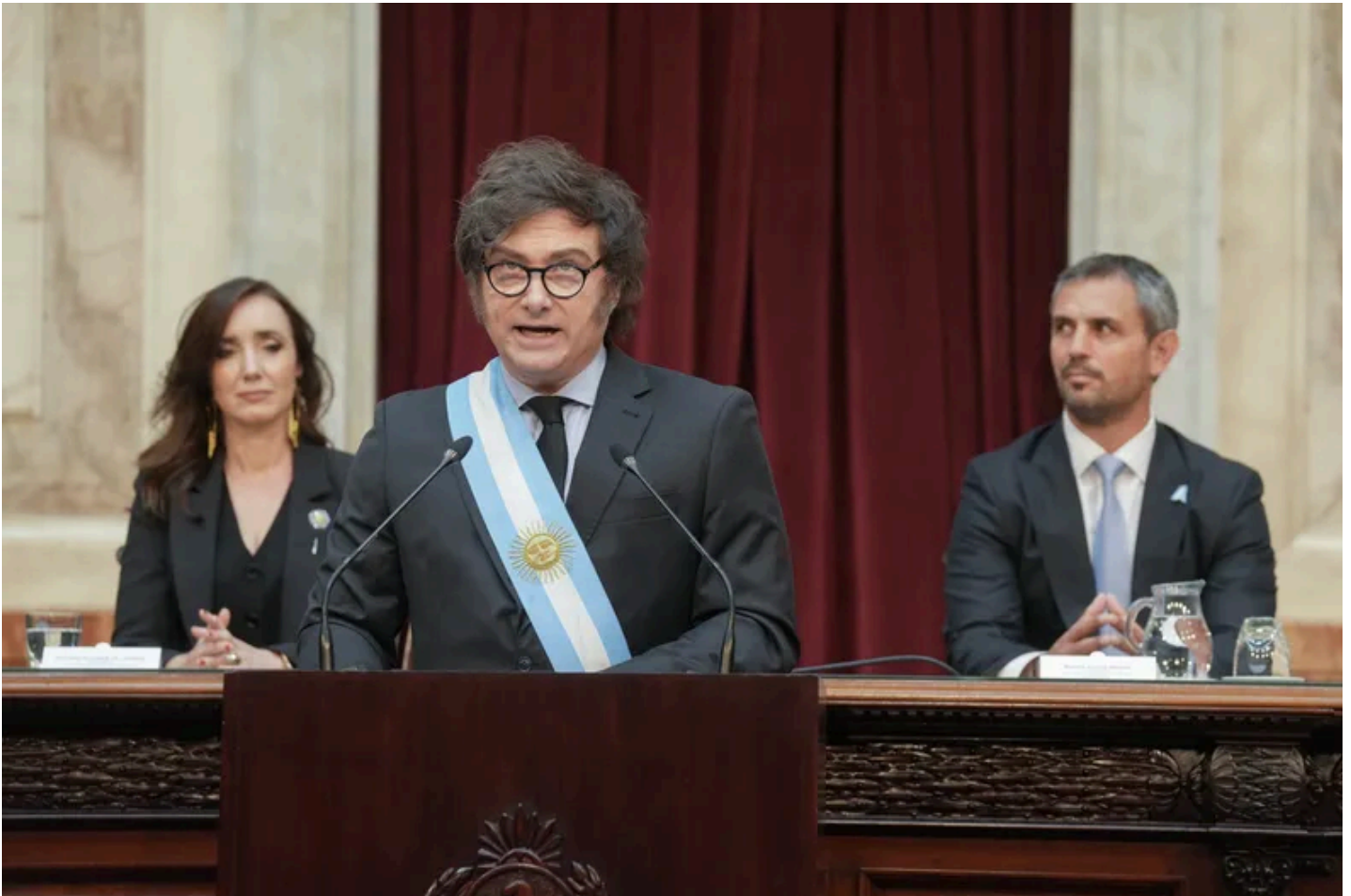
Las claves del discurso de Javier Milei en el Congreso: épica reformista, nueva gobernabilidad y prime time

Por cadena nacional, Javier Milei inaugurará este domingo, a las 21, un nuevo período de sesiones ordinarias en el Congreso . En lo que será su tercer discurso ante la Asamblea Legislativa, el Presidente repasará los principales hitos de su gestión -con foco en la economía y la reforma laboral - y hará hincapié en la importancia de respaldar sus nuevos proyectos.