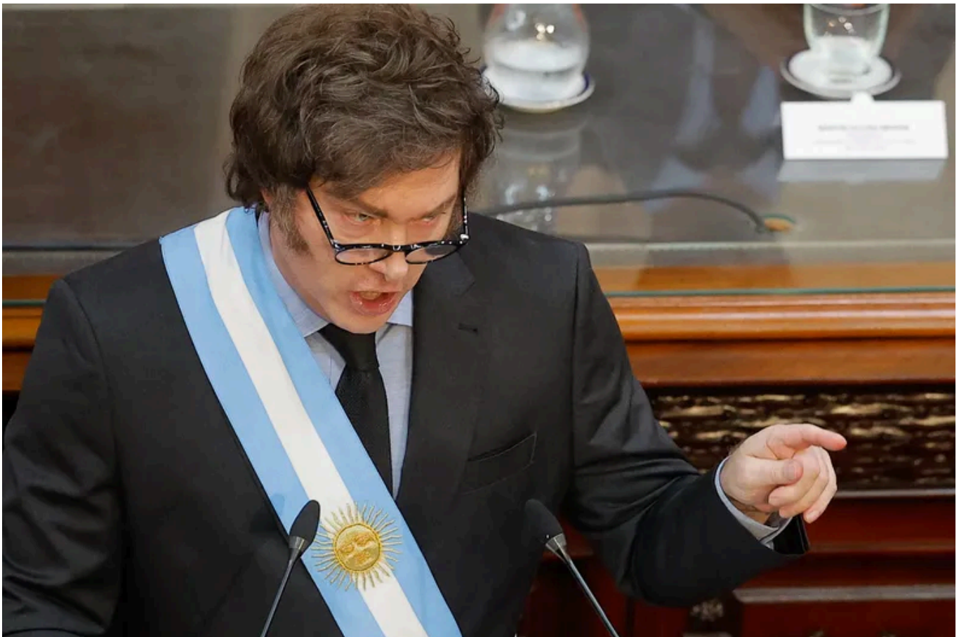
La agenda legisaltiva de Javier Milei que se viene.

Entusiasmado por el triunfo en la Cámara de Diputados , donde el oficialismo aprobó la reforma laboral con mínimos cambios, Javier Milei le encomendó a su mesa política diseñar una hoja de ruta legislativa con proyectos que considera claves para este año, incluyendo el nuevo Código Penal, las reforma electoral y tributaria y la denominada ley de glaciares, entre otros. ¿La reforma previsional? La enviará recién después del 2027, en un eventual segundo mandato.