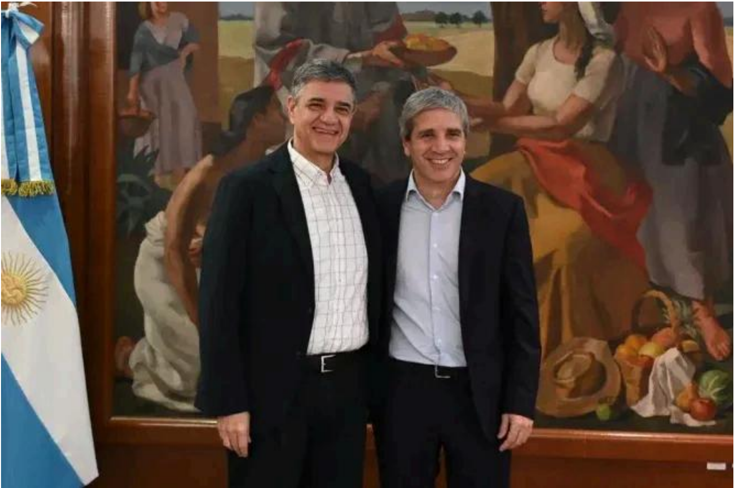
Jorge Macri y Toto Caputo.

La foto que selló el reencuentro entre Jorge Macri y Toto Caputo condensa algo más que una negociación técnica por unos puntos de coparticipación que la Ciudad le reclama a Nación: el intento de recomponer la relación política entre el PRO y La Libertad Avanza en el tablero porteño. Aunque la cita dejó gusto a poco, funcionó como un gesto de distensión en medio de la disputa por los fondos de coparticipación.