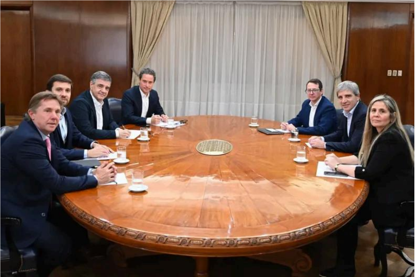
Jorge Macri y Toto Caputo, junto a colaboradores.

Desde Uspallata buscan que la Casa Rosada incluya en el Presupuesto 2026 la deuda por el 1,55% de la coparticipación, que asciende a $274.000 millones, en cumplimiento del fallo de la Corte Suprema que ordenó restituir los fondos recortados durante la gestión de Alberto Fernández .