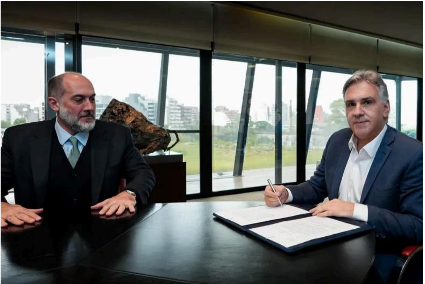
Martín Llaryora y su ministro de Economía, Guillermo Acosta

Tras su paso por la Casa Rosada , el gobernador Martín Llaryora adelantó que el Presupuesto 2026 que se debatirá en la Legislatura de Córdoba contemplará un programa de reducciones impositivas sin precedentes. Las rebajas apuntarán a comercio, servicios e inmuebles.