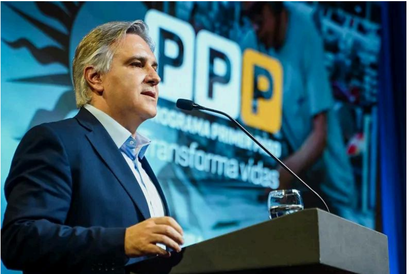
El gobernador de Córdoba, Martín Llaryora, durante el lanzamiento del Plan Primer Paso

Ahora, el gobernador Llaryora anunció que el Presupuesto 2026 incluirá una profunda baja de impuestos en Córdoba. Letra P pudo saber que el paquete de medidas apunta a aliviar la carga fiscal sobre el comercio , los servicios y el sector inmobiliario . Aunque sin definiciones de porcentajes, por el momento, adelantó que el plan “no se limitará a una baja general de impuestos”, sino que incorporará beneficios específicos para sectores que suelen quedar fuera de los programas fiscales.