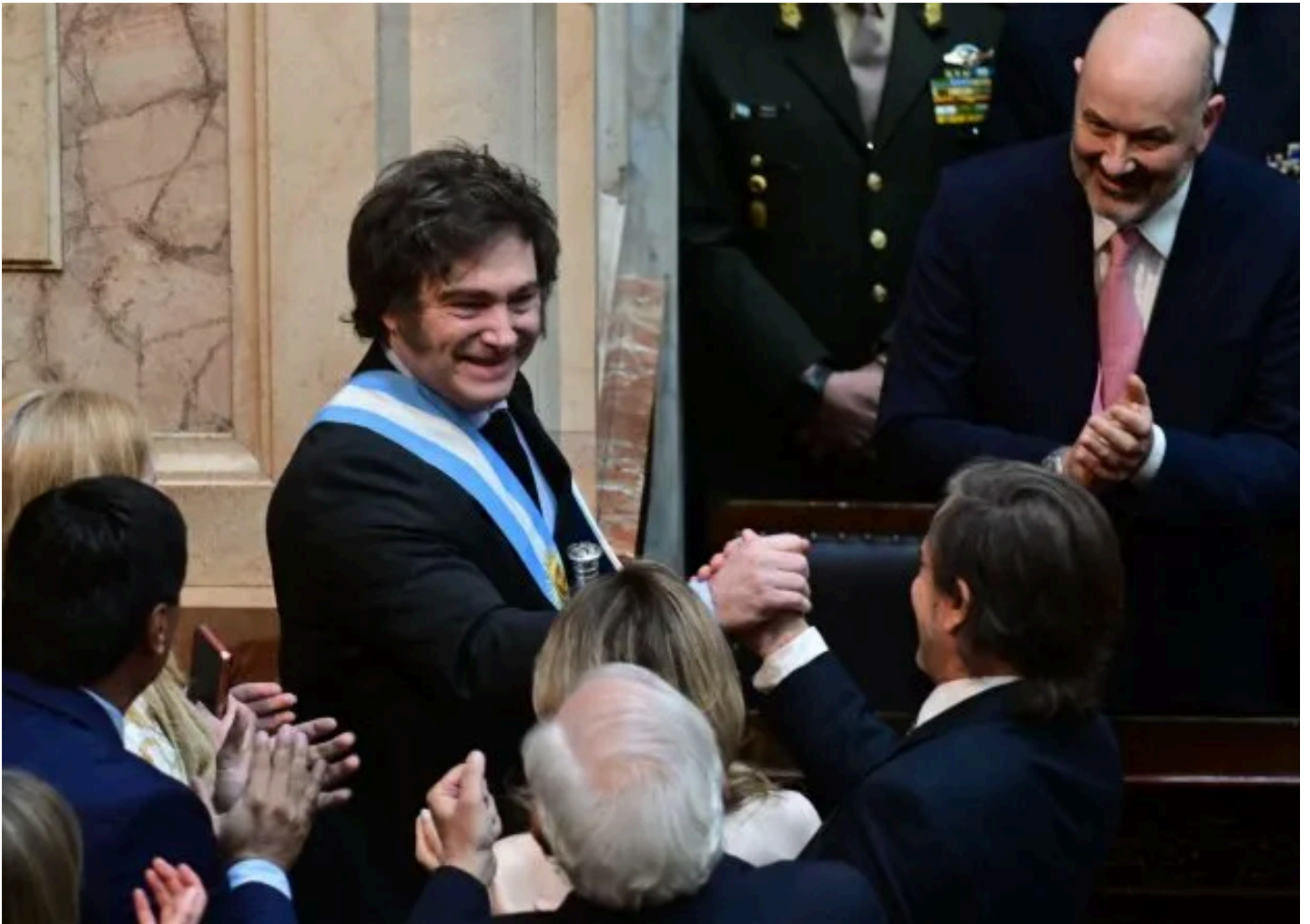
Javier Milei en el Congreso

El presidente Javier Milei logró una contundente victoria electoral que le permitirá engrosar sus bloques en ambas cámaras del Congreso . No tendrá mayoría propia, pero con aliados, de mínima, iniciará el 10 de diciembre con capacidad de defender eventuales vetos a leyes adversas.