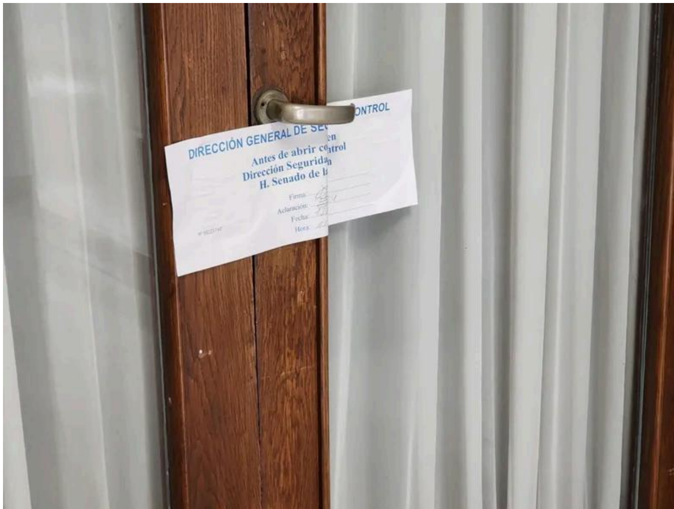
Despacho de Edgardo Kueider en el Senado

Hasta último momento, la tropa del PJ ortodoxa no estaba segura de impugnar el diploma de la rionegrina, por sus antecedentes judiciales en Estados Unidos, donde fue detenida hace más de 20 años por tenencia de cocaína.