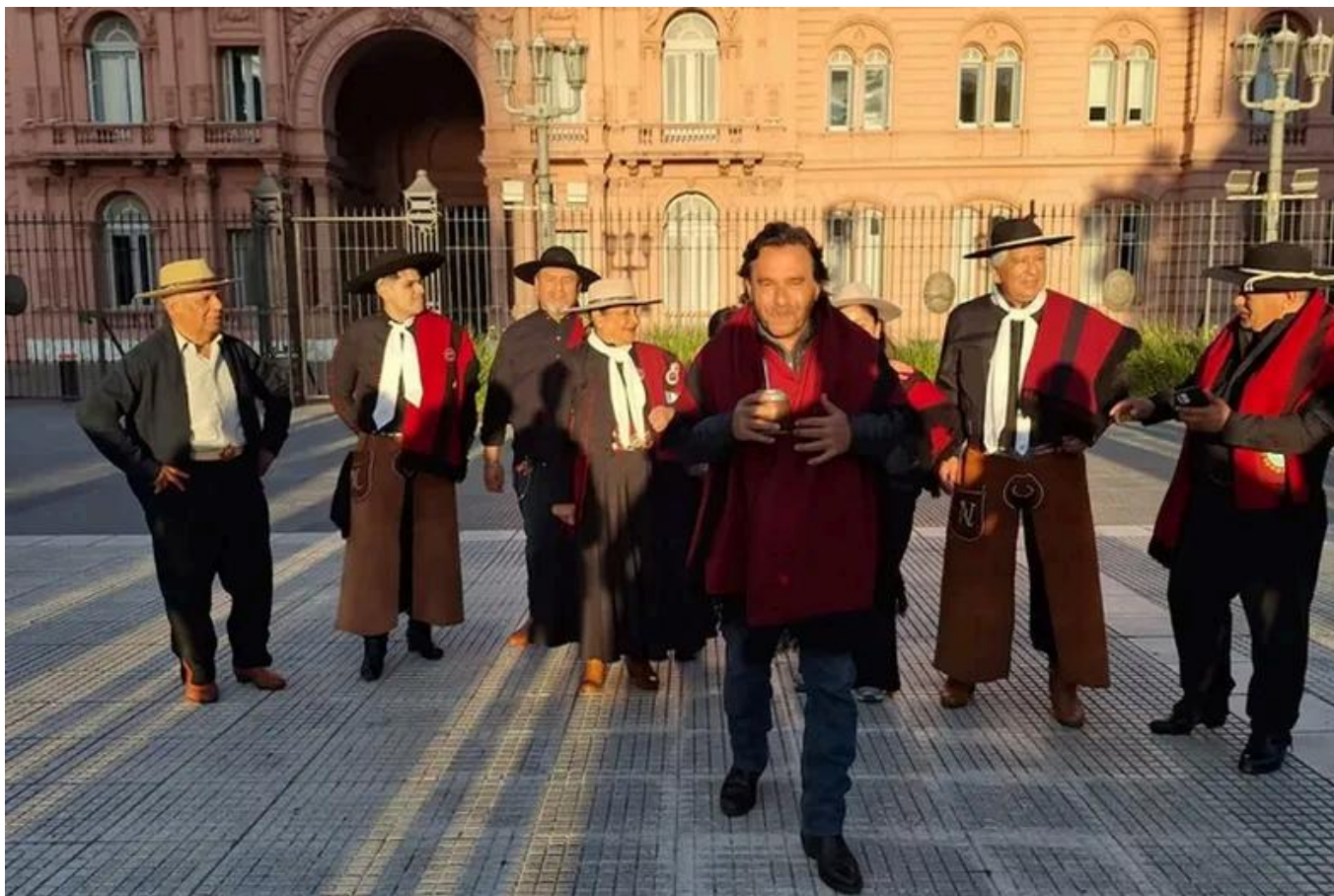
Gustavo Sáenz hizo una puesta en escena para protestar en la Casa Rosada: mate y folclore autopercebido peronista.

Sáenz, por si acaso, marcó la cancha. Dijo en los medios que no será aliado automático de Milei y esperará que, de mínima, se reactive la obra pública. También recordó que es un enemigo de CFK, al punto que lo prefiere al Presidente en un mano a mano.