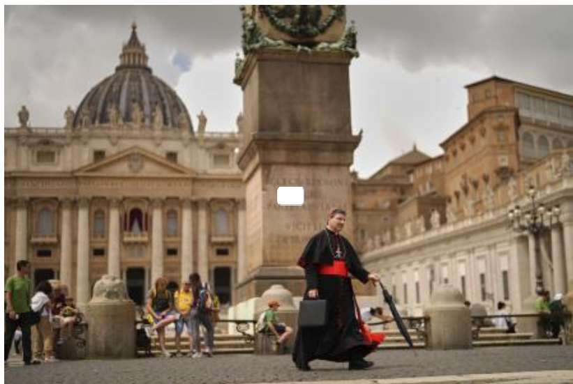
El cardenal Francis Leo camina por la plaza de San Pedro horas antes del inicio del cónclave

Ya por la noche se producirá la primera y única fumata del día. Si es negra, se continuará con cuatro votaciones diarias hasta el sábado, jornada de pausa y reflexión.