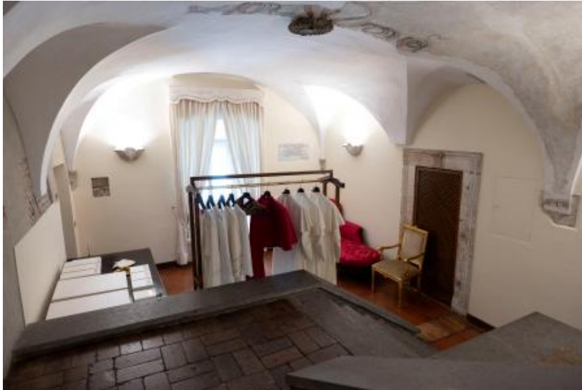
Vista de la 'Sala de las Lágrimas', una pequeña sala junto a la Capilla Sixtina

Ángel Fernández Artime, asturiano, rector mayor de los Salesianos, con amplia experiencia en América Latina y bien considerado en Roma.