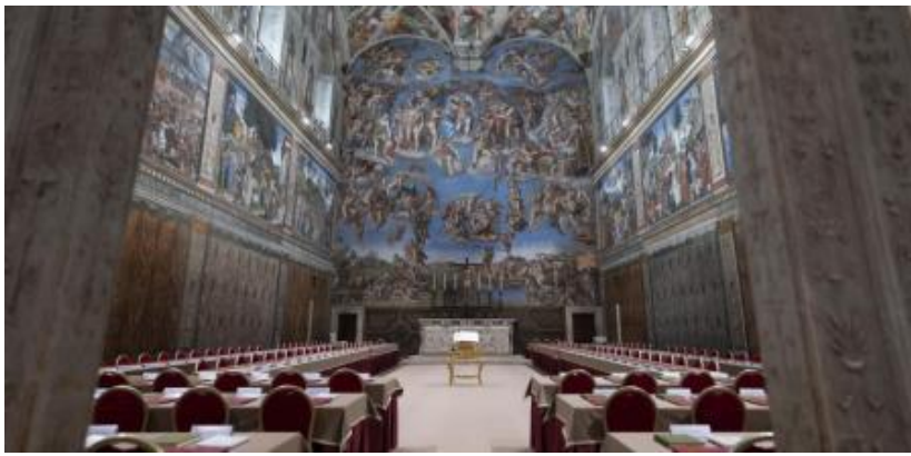
Vista de la Capilla Sixtina, acondicionada con mesas y sillas, donde esta tarde comenzarán las votaciones del cónclave