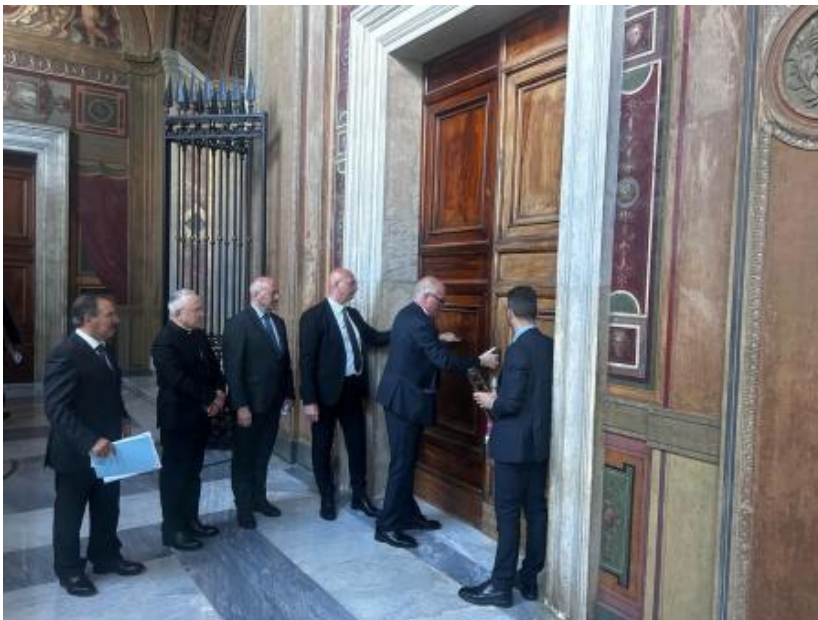
Las entradas al Palacio Apostólico se cerraron antes del cónclave

La opción asiática, en cambio, sigue presente en muchos cardenales, manteniendo viva la candidatura de Tagle a pesar de los continuos ataques provenientes de sectores conservadores.