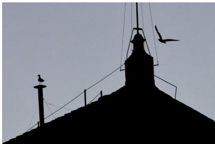
Todo listo en la Capilla Sixtina, incluida su famosa chimenea

No obstante, desconfiando un poco, el Governatorato (el órgano que gestiona el Estado vaticano) ha ordenado desconectar los repetidores de las compañías telefónicas. Probablemente también bloquearán la señal que llega desde territorio italiano.