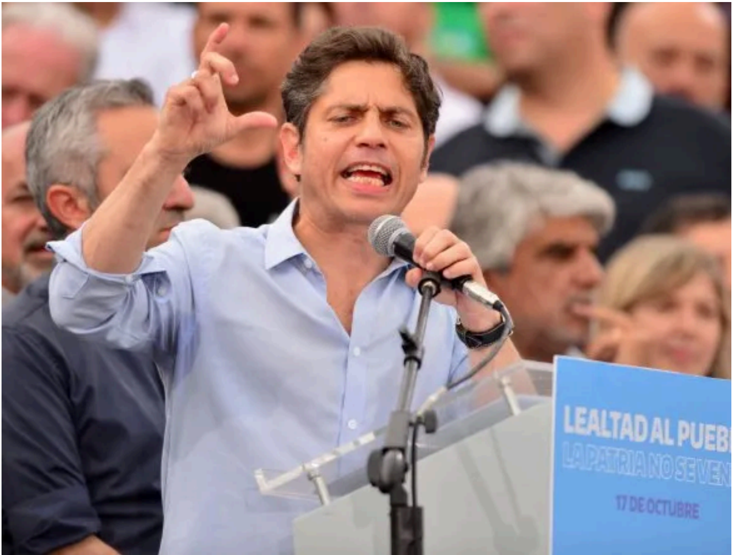
Axel Kicillof en Berisso, por el 17 de octubre.

El quiebre total entre Cristina Fernández de Kirchner y Axel Kicillof , sellado este lunes con la decisión del gobernador de adelantar las elecciones en Buenos Aires , justamente a contramano de lo que exigía la expresidenta, es el desenlace de una relación bienparida que comenzó a resquebrajarse hace exactamente tres años y medio.