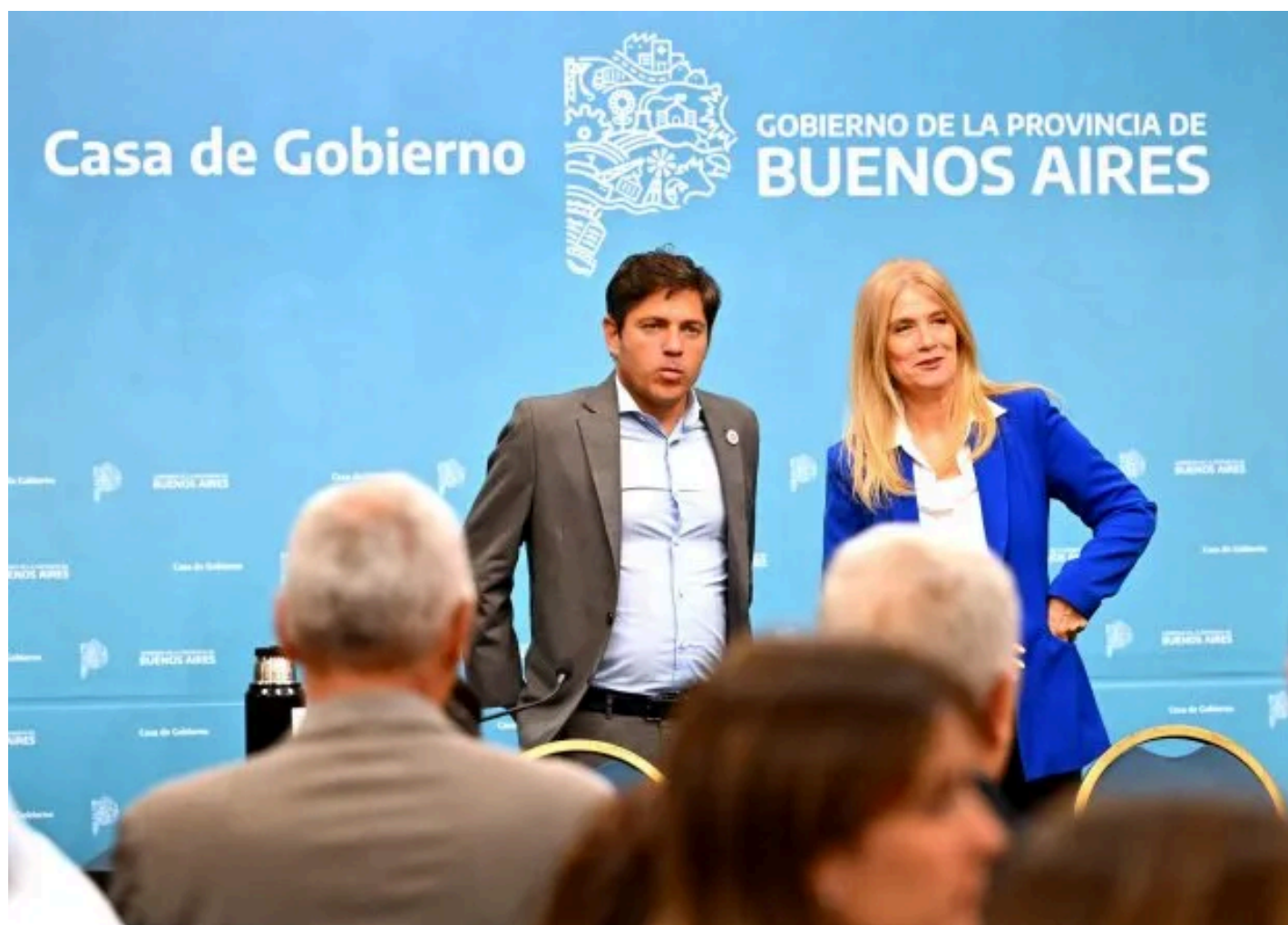
Axel Kicillof y Verónica Magario.