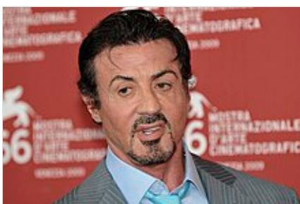
Stallone en 2009.

Stallone ha rechazado numerosos papeles en importantes producciones. Entre los más destacados se encuentran: los papeles de Arnold Schwarzenegger en The Terminator (1984) y Batman y Robin (1997); los de Michael Douglas en Romancing the Stone (1984) y Basic Instinct (1992); el papel de Keith Carradine en Pretty Baby (1978); los de Richard Gere en Cotton Club (1984) y Pretty Woman (1990); el de Christopher Reeve en Superman: la película (1978); el papel de Jon Voight en Coming Home (1978); el de Nick Nolte en 48 Hrs. (1982); el papel de Eddie Murphy en Beverly Hills Cop (1984); el de Harrison Ford en Witness (1985); el papel de Bob Hoskins en ¿Quién engañó a Roger Rabbit? (1988); el de William Baldwin en Fair Game (1995); el papel de Bruce