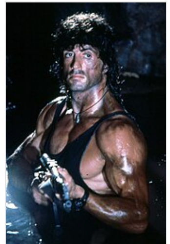
Stallone en Rambo III (1988).

Entre sus trabajos cinematográficos, destaca su actuación en First Blood , donde interpretó a un atormentado veterano de guerra llamado John Rambo: este es agredido por un abusivo jefe de policía pueblerino, lo que lo fuerza a desatar una ola de venganza. La crítica aclamó su actuación, afirmando que le había dado un aspecto más humano que el que tenía originalmente el personaje en la novela. Durante la década de los 80, le siguieron Rambo II y Rambo III , que fueron enormes éxitos internacionales en la taquilla.