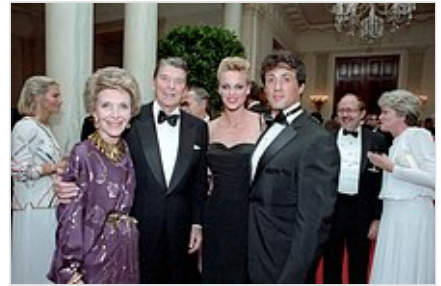
Stallone con su segunda esposa Brigitte Nielsen , Ronald Reagan y Nancy Reagan en 1985.

En agosto de 2022, aclaró ante los medios las razones de su divorcio con Jennifer Flavin , que habría presentado la demanda de divorcio sin razón aparente. Los medios informativos aseguraban que Flavin no aceptaba la presencia de su perro Dwight ni un tatuaje del brazo derecho de Stallone que suplanta con la cara de su perro Rottweiler , el rostro de Flavin.