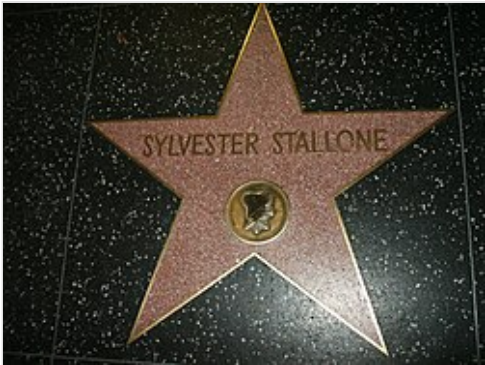
Estrella de Stallone en el Paseo de la Fama de Hollywood .