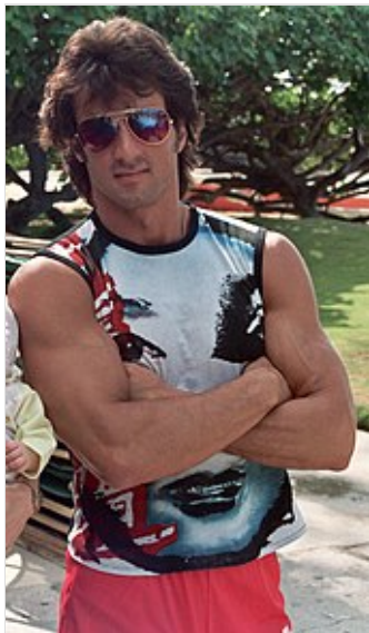
Stallone en 1983.

Stallone intentó revivir éxitos del pasado mediante las películas Rocky Balboa (2006) y Rambo (2008). A pesar del abuso ejercido en ambas franquicias y en contra de las predicciones de los críticos de cine, las dos cintas tuvieron buena recepción por parte de la audiencia y dieron un respiro a su carrera.