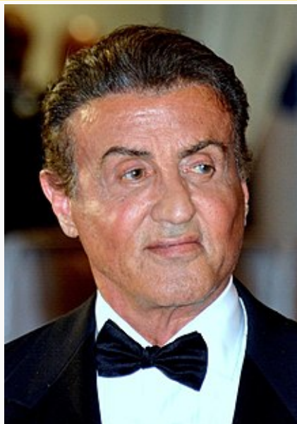
Stallone en 2019