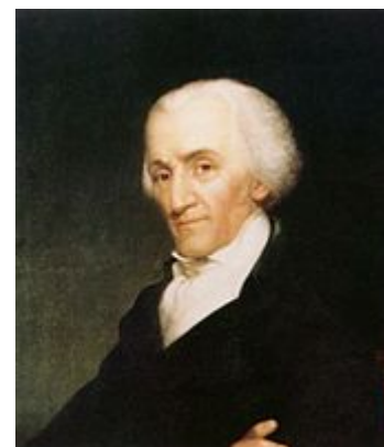
Elbridge Gerry se opuso a la Constitución tal como estaba redactada, aunque sus razones para hacerlo no estuvieron fuertemente influenciadas por la rebelión.

Los federalistas citaron la rebelión como un ejemplo de las debilidades del gobierno de la confederación, mientras que opositores como Elbridge Gerry pensaron que una respuesta federal a la rebelión habría sido incluso peor que la del estado. —Gerry, un especulador mercantil y delegado de Massachusetts en el condado de Essex , fue uno de los pocos delegados a la convención que se rehusó a firmar la nueva constitución, aunque sus razones para hacerlo no se derivaron de la rebelión—. 73