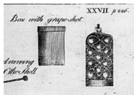
Detalle de un racimo de metralla en un dibujo de municiones de artillería de la guerra de Independencia de los Estados Unidos .