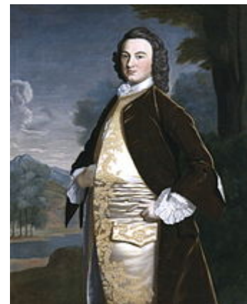
El gobernador James Bowdoin instituyó una pesada carga impositiva y aumentó la recaudación de impuestos atrasados.

Bowdoin había perdido repetidas veces ante Hancock en elecciones anteriores, pero fue elegido gobernador ese año, y las cosas se volvieron más graves. Él intensificó las acciones civiles para cobrar los impuestos atrasados, y la legislatura exacerbó la situación mediante la imposición de un impuesto adicional a la propiedad para recaudar fondos para la parte del estado de los pagos de la deuda externa. 16 Incluso comentaristas comparativamente conservadores como John Adams observaron que estos gravámenes eran «más pesados de lo que la gente podía soportar». 17