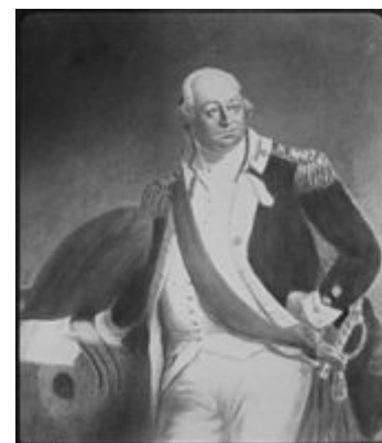
General Benjamin Lincoln , retratado por Henry Sargent.

El general Lincoln inmediatamente comenzó a marchar hacia el oeste desde Worcester con los 3.000 hombres que habían sido reunidos. Los rebeldes se movieron generalmente al norte y al este para evitarlo, y finalmente establecieron un campamento en Petersham . Asaltaron las tiendas de los comerciantes locales para tener suministros para el camino y tomaron algunos de los comerciantes como rehenes. Lincoln los persiguió y llegó a Pelham el 2 de febrero, a unos 48 km de Petersham. 44 Lideró a su milicia en una marcha forzada a Petersham a través de una tormenta de nieve en la noche del 3 al 4 de febrero, llegando temprano por la mañana. Sorprendieron al campamento rebelde tan a fondo que los rebeldes se dispersaron «sin tiempo para llamar a sus partidos o incluso a sus guardias». 45 Lincoln afirmó haber capturado a 150 hombres, pero ninguno de ellos era oficial, y el historiador Leonard Richards ha cuestionado la veracidad del informe. La mayoría de los líderes escaparon al norte hacia New Hampshire y Vermont , donde se refugiaron a pesar de las reiteradas demandas de que fueran devueltos a Massachusetts para su juicio. 46