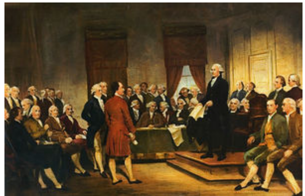
La Convención Constitucional de 1787, por Junius Brutus Stearns, en 1856.

En el momento de la rebelión, las debilidades del gobierno federal según lo constituían los artículos de la Confederación eran evidentes para muchos. Se estaba produciendo un vigoroso debate en todos los estados sobre la necesidad de un gobierno central más fuerte, con los federalistas que defienden la idea y los antifederalistas que se oponen a ellos. La opinión histórica está dividida sobre qué tipo de papel desempeñó la rebelión en la formación y posterior ratificación de la Constitución de los Estados Unidos , aunque la mayoría de los estudiosos coinciden en que desempeñó algún papel, al menos temporalmente atrayendo a algunos antifederalistas al lado fuerte del gobierno. 63