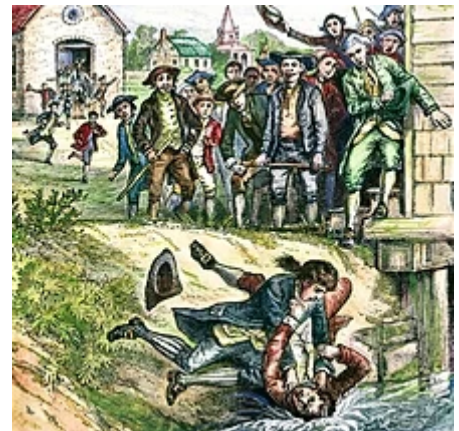
Manifestantes mirando a un deudor en una pelea con un recaudador de impuestos por el tribunal en Springfield, Massachusetts

La Rebelión de Shays fue un levantamiento armado en Massachusetts , principalmente en Springfield y sus alrededores durante 1786 y 1787. El veterano estadounidense de la Guerra de Independencia de los Estados Unidos Daniel Shays lideró a cuatro mil rebeldes (llamados shaysites) en una protesta contra las injusticias económicas y civiles percibidas. Shays era un granjero de Massachusetts al comienzo de la Guerra de Independencia; se unió al Ejército Continental, participó en las batallas de Lexington y Concord , Batalla de Bunker Hill y Batallas de Saratoga , y finalmente fue herido en combate.