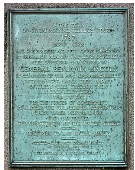
Monumento a Benjamin Lincoln en conmemoración del final de la rebelión el 4 de febrero de 1787, en Petersham.

En la ciudad de , un monumento fue erigido en 1927 por la Sociedad de Nueva Inglaterra de Brooklyn, Nueva York. El monumento conmemora al general Benjamin Lincoln, que recaudó 3.000 soldados y desmanteló la rebelión el 4 de febrero de 1787. Termina con la frase: «La obediencia a la ley es la verdadera libertad». 81